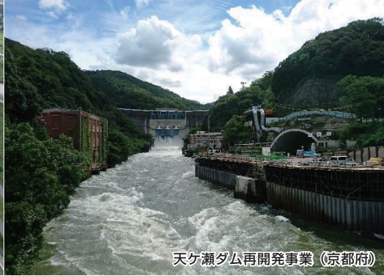
天ヶ瀬ダム再開発事業 (京都府)