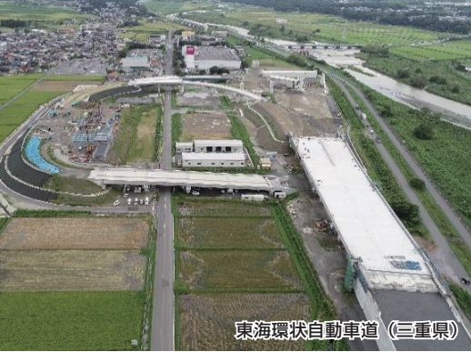
東海環状自動車道 (三重県)