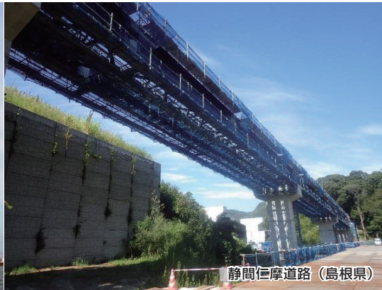
静間仁摩道路 (島根県)