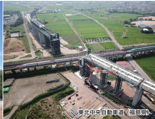
東北中央自動車道 (福島県)