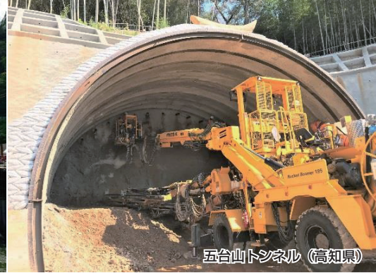
五台山トンネル (高知県)