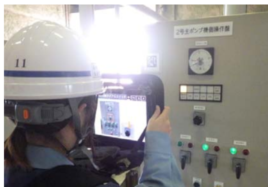
写真-2 新規採用職員による運転操作状況

そして、その操作記録は自動作成され、操作報告書の作成時間の大幅な短縮に繋がった。