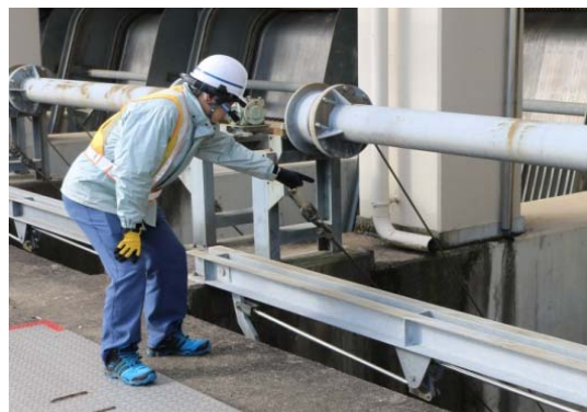
写真-3 流木集積時の対応状況

不具合対応支援システムについては、同じく2017年の防災業務時に排水機場スクリーン前面部に大量の流木が集積した際、専門技術職が現地に向かわずとも現地班から送信された画像等の情報により遠隔地から対応を指示し、ポンプを停止するに至らず、運転を継続することができた（写真-3）。