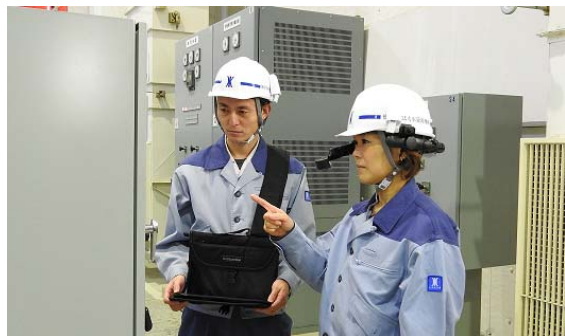
写真-1 職員支援システム使用状況