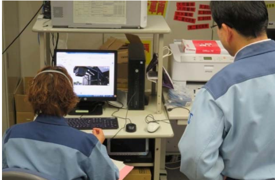
写真-4 防災本部での通信状況

また、適宜、琵琶湖総管の防災本部や各管理所の班長等が現場状況の確認等に本システムを使用することにより、現場までの移動時間の削減、移動に伴う事故のリスク減に繋がり、その効果を確認した（写真-4）。