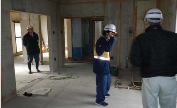
写真-7 抜き打ちパトロール状況

このように少人数で実施する抜き打ちパトロールでありながら、多くの目で指摘できることから効率的なパトロールと言える。また、HMD装着者を若手職員とし、支援者（総合管理所）側から不安全行動を指摘することで、若手職員の安全教育ツールとしても期待できる。