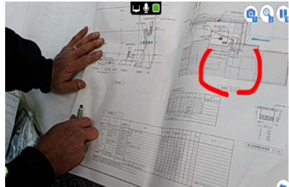
写真-5 遠隔地からの指示状況

関西管内の機構事務所においても琵琶湖総管と同様、移動に時間を要することから、建築工事における不具合対応支援システムの活用は有効であると言える。