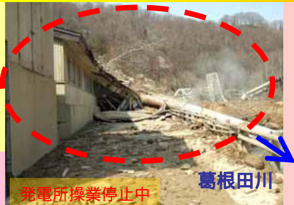
発電所操業停止中