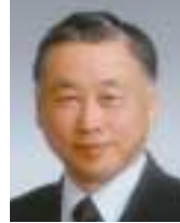
上智大学経済学部教授 国土審議会計画部会委員、 同ライフスタイル・生活専門委員会委員長