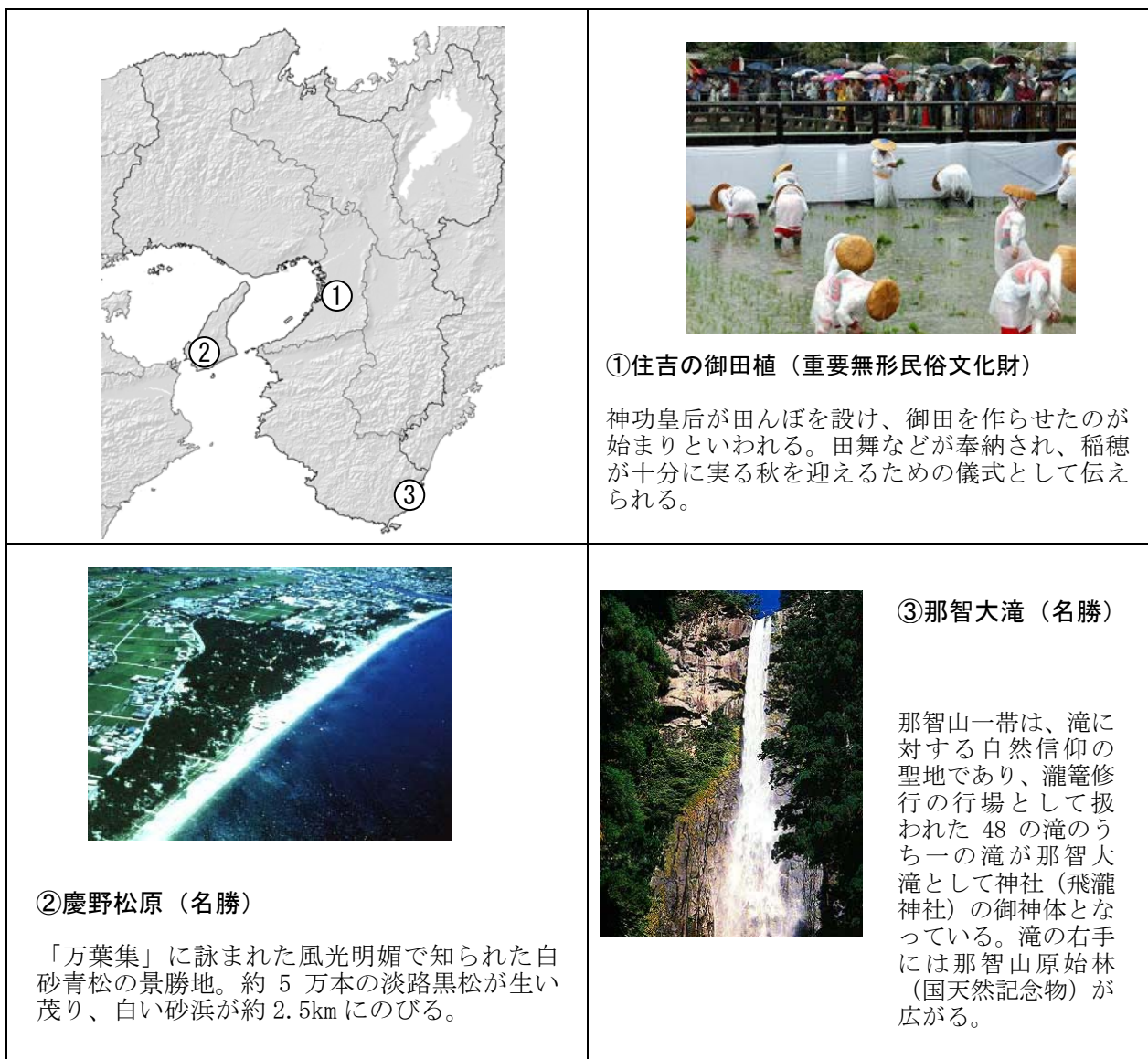
図エラー! 指定したスタイルは使われていません。-1 : 自然環境と一体となる文化資源の例

また、各地の産業を支える農山漁村の自然環境と共生する暮らしの中で育まれた伝統が、地域独自の文化として醸成され、豊かな文化的自然環境を形成している。(図エラー! 指定したスタイルは使われていません。-1, 図エラー! 指定したスタイルは使われていません。-2)