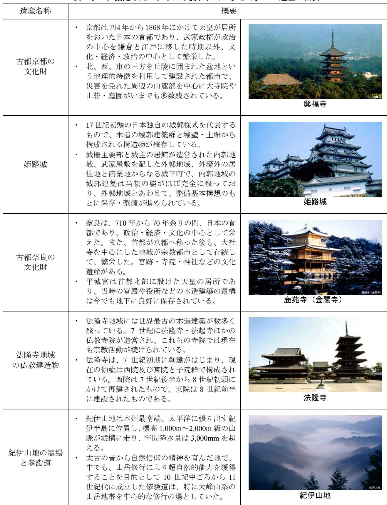
表エラー！ 指定したスタイルは使われていません。-2：遺産の概要