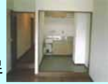
バリアフリー化されていない住宅の例