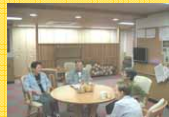
高齢者生活支援施設