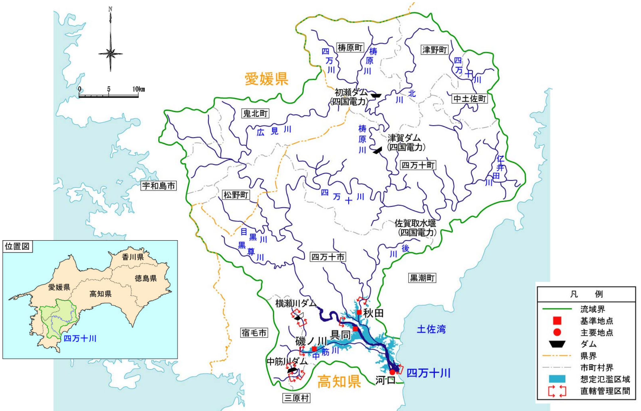
(参考図) 渡川水系図