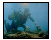
地域主体でのサンゴ礁保全の取組

振興開発に係る関係者間の連携及び協力の確保について、基本方針(国策定)、計画(鹿児島県・東京都策定)等に位置づけ(奄美・小笠原)