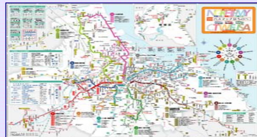
『3事業者共通 '09バスマップはちのへ』

バスマップに掲載している路線ナンバリングにあわせて、バスの行先表示(LED・方向幕)等を改修・更新する。