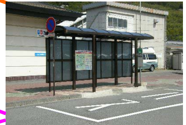
バスシェルターの整備