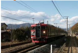
イベント列車の運行