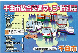
総合時刻表の作成・配布

総合時刻表の作成、バスシェルターの整備、バス停のバリアフリー化、イベント列車の運行、タクシーによる観光振興の支援等を実施し、住民の公共交通機関利用意識の向上を図る。