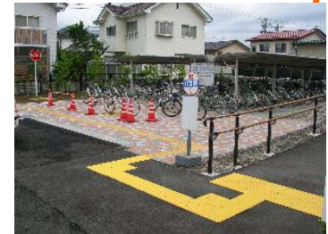
バス停のバリアフリー化