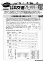
公共交通だよりの発行