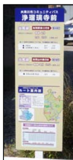
分かりやすい情報提供整備