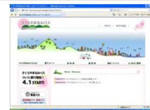
さくらやまなみバスHP

http://www.nishi.or.jp/homepage/keikaku/bus.html