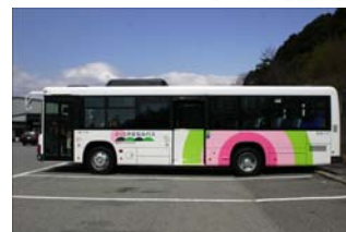
さくらやまなみバス

広告付きバス停留所上屋の整備、「西宮市バス停留所上屋整備費補助金交付制度」を活用したバス停留所上屋整備、「公共交通円滑化設備整備費補助制度」を活用した超低床ノンステップバスの導入、バス乗り継ぎ運賃の割引制度等の推進及び検討を行う。