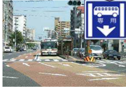
バス専用・優先レーン