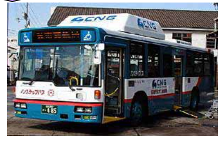
CNGバス等の低公害車の導入