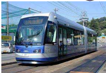
LRTプロジェクトの推進