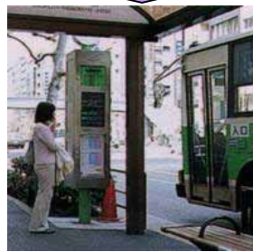
バスロケーションシステム