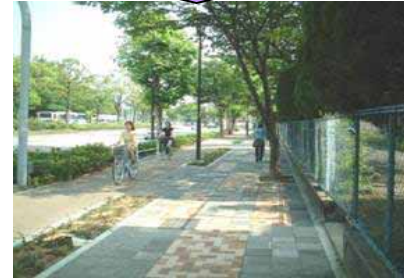
歩道、自転車道の整備