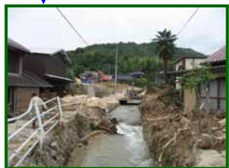
奈美川(なみがわ) 砂防えん堤工 1基(高さ約9m)