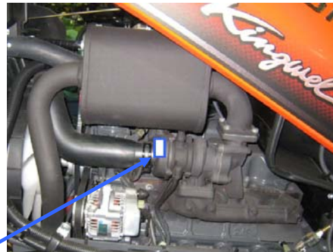
交換後の過給器の銘板位置