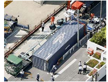
コンテナ落下事故(H21.5)[名古屋市]