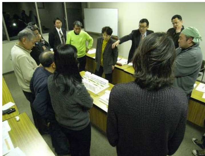
取組③の写真 作業部会の様子(1/100模型を囲んで議論)