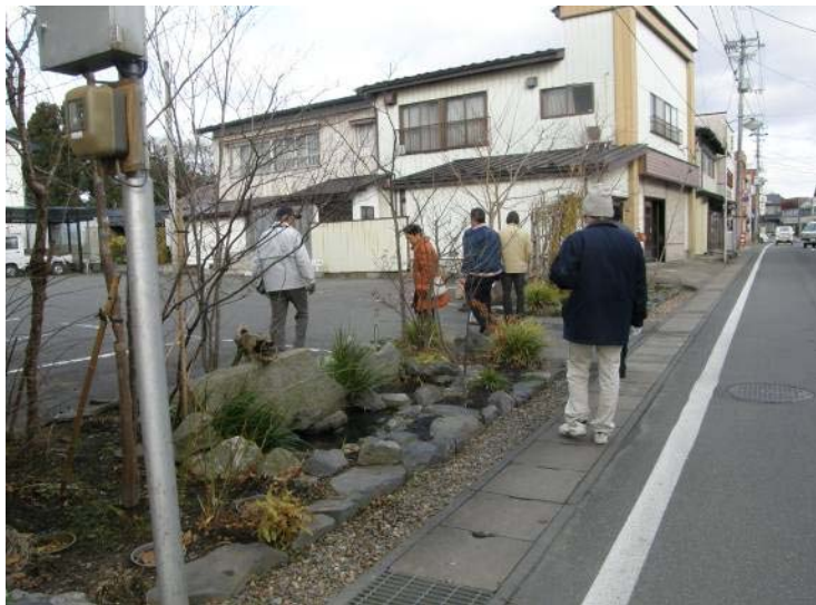
取組①の写真 「作業部会」メンバーによる現況調査