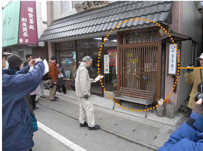
取組③関連図 具体的な形・素材の目安（例）