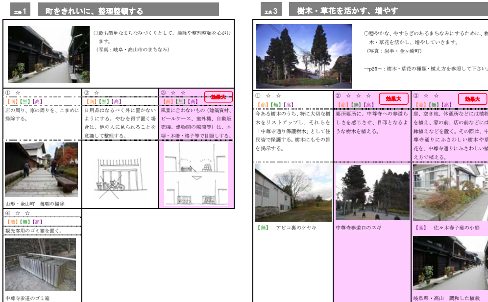
取組③関連図 まちなみづくりの工夫点(例)