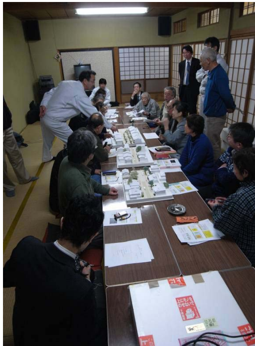
取組③の写真 まちづくり懇談会の様子(1/100模型を囲んで議論)