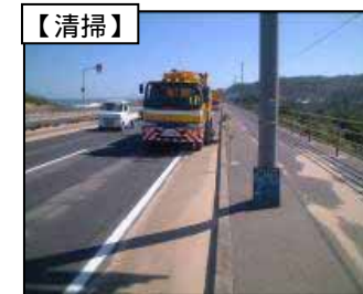
【経常的な作業イメージ】