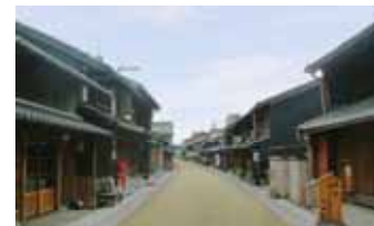
整備イメージの作成 【岐阜県岐阜市】