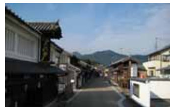
軒下配線 【三重県亀山市関町】