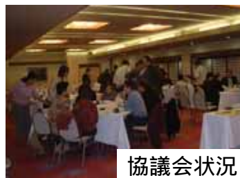
協議会状況 【岐阜県岐阜市】