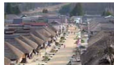
裏配線 【福島県下郷町大内宿】