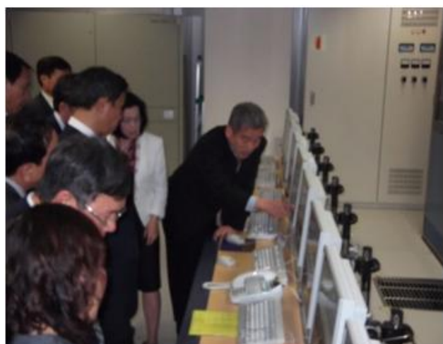
(財)道路交通情報通信システムセンターの視察