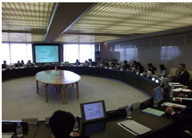
③国土技術政策総合研究所等への訪問・意見交換