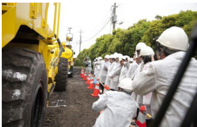
舗装補修施工現場の視察