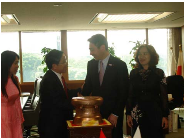
①前原国土交通大臣表敬