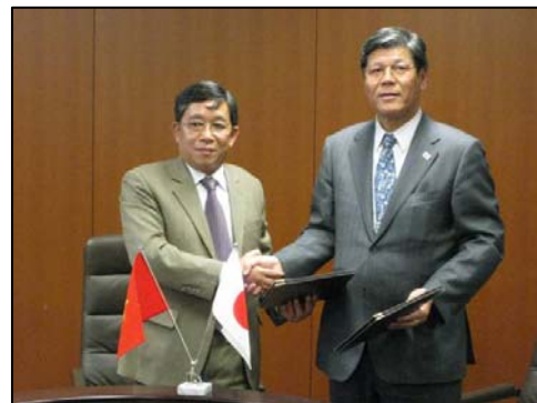
技術協力に関する覚書の締結