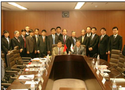
第2回セミナーの様子

概要：国土交通省、ベトナム国道路官民研究会との意見交換、高速道路の整備、運営・維持・管理の現場視察を実施。道路分野において国土交通省とベトナム国交通運輸省の協力関係の強化を目的とした覚書を締結。