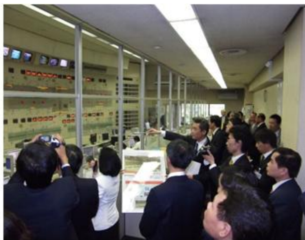
川崎道路交通管制センターの視察