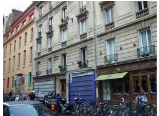
写真1：空き店舗化している1階部分

パリ市内の11の地域の建物の1階部分を取得していった。取得にあたっては、パリ市が購入・取得する場合とSEMAEST（パリ市が出資する混合経済会社）が購入・取得する場合の2種類があるが、パリ市が所有する場合もSEMAESTに取得の代行や運営の権限が与えられている。