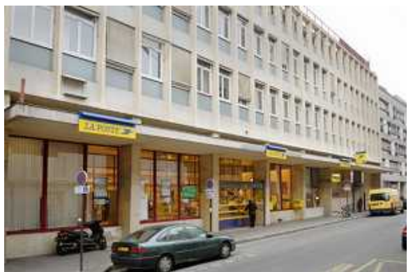
写真2：改装し新たに店舗を誘致した建物（SEMAEST）

なお、取得不動産に関する賃料未収リスクについては、SEMAESTが負担する仕組みとなっている。