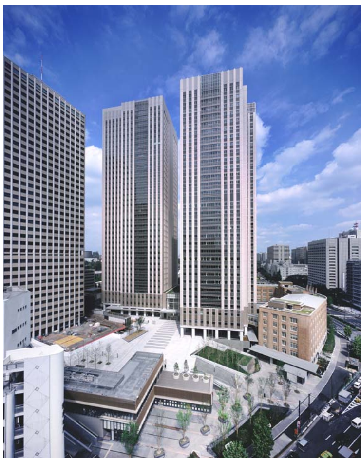
中央合同庁舎第7号館