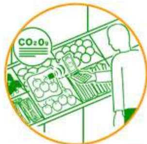
カーボン・フットプリントで 商品を選択