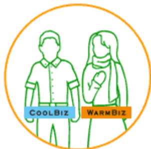
クールビズや ウォームビズの実践