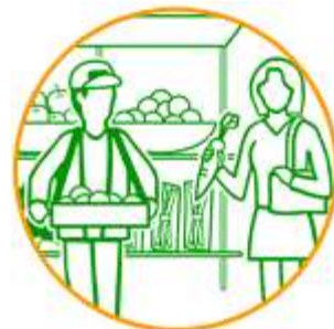
地元食材を使って 地産地消