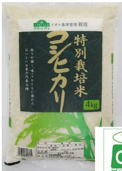
滋賀県産こしひかり