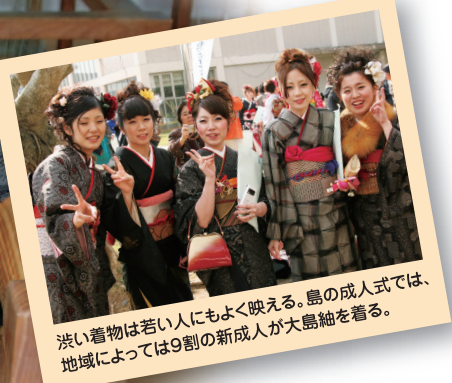
渋い着物は若い人にもよく映える。島の成人式では、地域によっては9割の新成人が大島紬を着る。