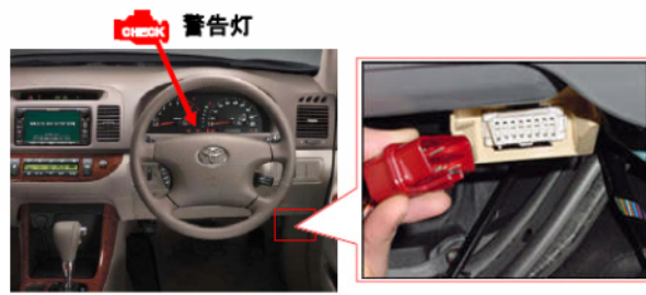
スキャンツール用コネクタの位置の例