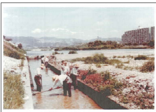
浚渫作業(昭和50年頃)