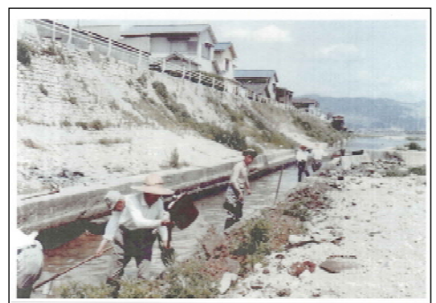
浚渫作業(昭和50年頃)