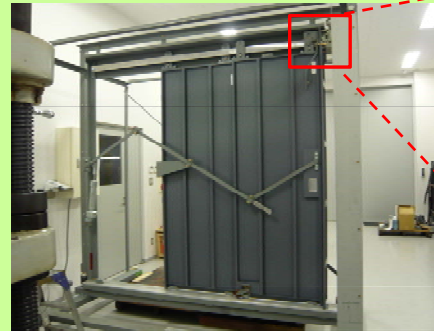
乗り場戸の施錠装置の構造 (写真は再現機のもの)