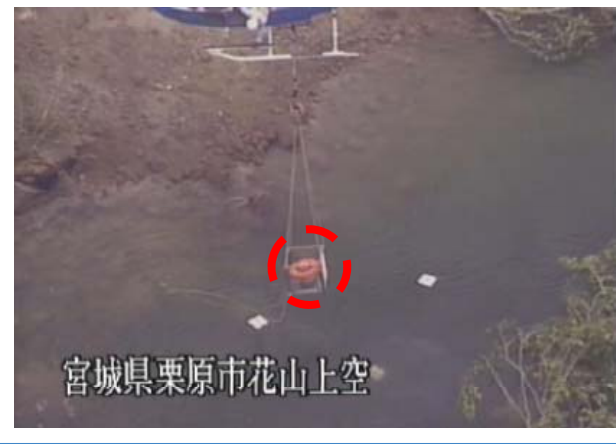
アクセスが困難な箇所への投下型水位観測ブイ運搬