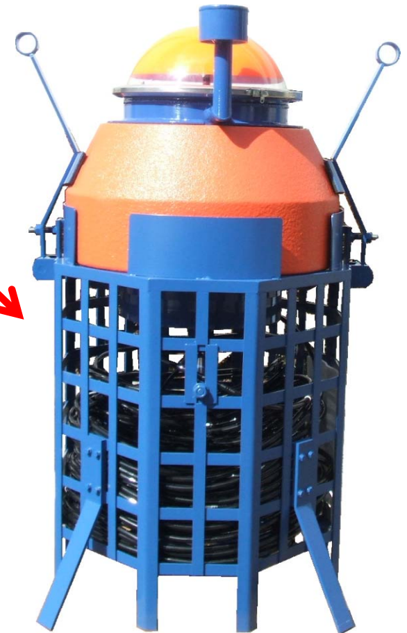
投下型水位観測ブイ 拡大写真