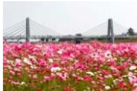
七城の菊池川沿いのコスモス