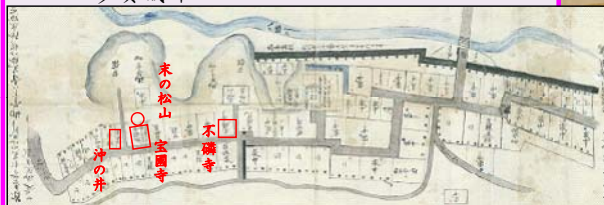
宮城郡八幡邑天童氏屋敷並びに家中・足軽屋敷絵図(1681年)