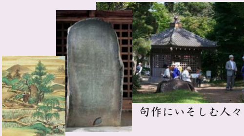
句作にいそしむ人々