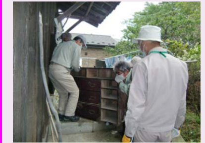
被災した資料の搬出状況

震災により被災した文化財等について、調査を実施し、保存措置を講じるとともに、調査資料の展示公開を図ります。