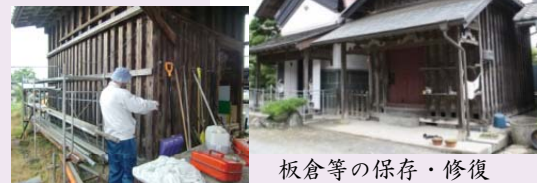
板倉等の保存・修復

震災で壁などが崩落した板倉・石倉・土蔵等の築年・構造・状態等の情報を収集します。維持・保存を奨励し、歴史的風致の維持向上に寄与します。改修時には費用の一部を助成します。