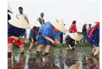
【人の交流】塗別小学校(幕別町)