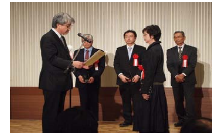
第5回コンクール 表彰式

活動の支援や運動の普及啓発を目的に地域住民主体の優れた取組について景観、地域特産物、人の交流の3部門において審査し表彰。第1回から5回までのコンクールで延べ1040件の応募から100件を表彰