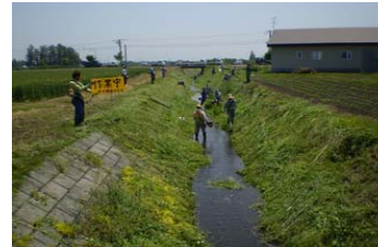
【景観】万年環境保全会(音更町)