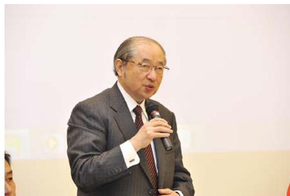
小島座長のご挨拶