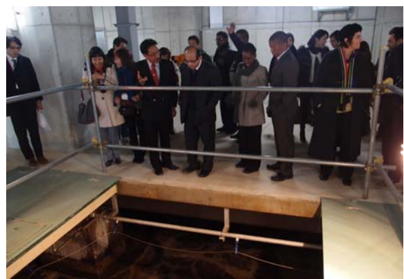
横浜市環境創造局 北部下水道センターの視察