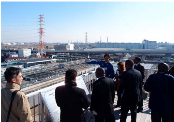
東京都水道局三園浄水場の視察