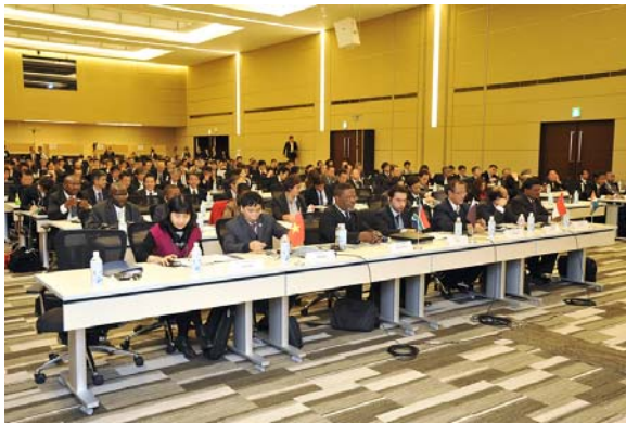
各国からの招聘者