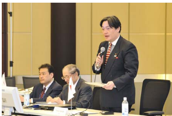
吉田国土交通副大臣のご挨拶

※ 各国から参加された方々は、協議会の当日2月16日には「第3回国際水ソリューション総合展（InterAqua 2012）」（東京国際展示場で開催）を、翌日2月17日には、東京都水道局三園浄水場及び横浜市環境創造局北部下水道センターを視察されました。