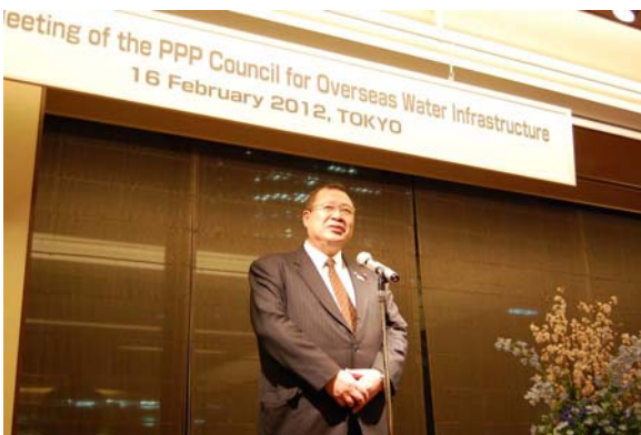
招聘者・協議会委員の懇親会での 津島国土交通大臣政務官のご挨拶