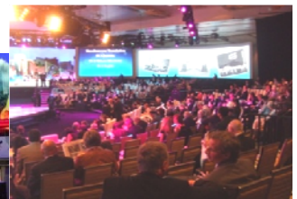
<ラスベガスサミットの様子>