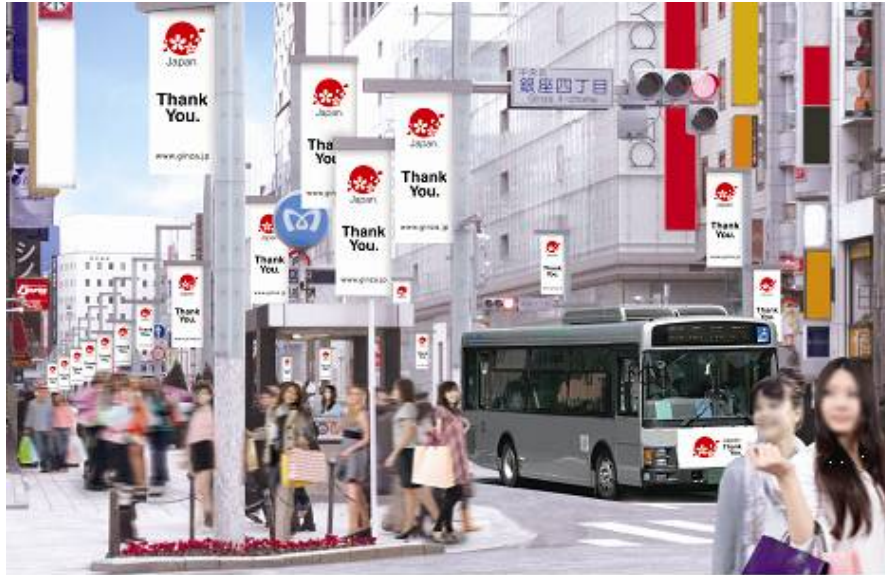
中央通り（銀座通り）（イメージ）

東京（銀座、丸の内、秋葉原、浅草等）、横浜、京都、大阪、仙台等の外国人旅行者の多い大都市を中心に、商店街バナー、バス・タクシー車体、ホテル・フラッグなどへ「Japan. Thank You.」ロゴを掲出。来訪した外国人に対する「感謝」と「歓迎」ムードを醸成。