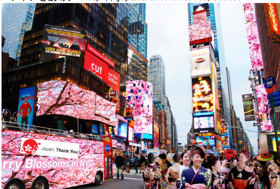
Cherry Blossoms Square（イメージ）

ニューヨークのタイムズスクエア周辺に桜を咲かせます。Thank You ロゴとともに、主要スクリーンに「桜」をモチーフにした訪日促進映像を放映。日米桜寄贈100周年記念関連イベントとともに、訪日機運を醸成。3月1日（11時）には、着物隊とともに点灯式を実施（予定）。着物隊はグランドセントラルステーションのイベント「Japan Week」へ米国主要メディアを誘導。 http://japantravelinfo.com/events