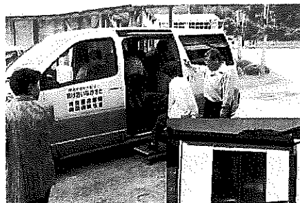
写真-1 なかさと号とNPO事務所

他の交通空白地域として困っている方々のご参考になればと思い「なかさと号」の立ち上げ経緯と現状について報告する。