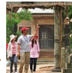
島のガイドツアー