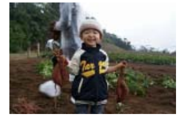
ブランド芋の大収穫祭