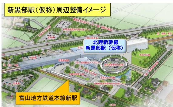
富山地方鉄道本線の新駅設置

整備新幹線の開業効果を周辺地域に広く波及させるため、平成26年度末の北陸新幹線の開業に合わせて、地域の鉄道の新幹線乗継駅の新設等を支援し、交通結節点機能の強化を図る。