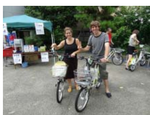
東山キャンペーン