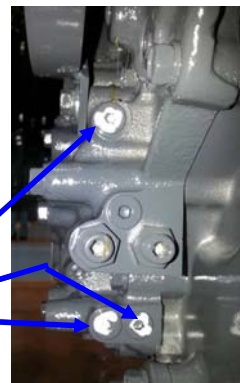
白ペイントを塗布