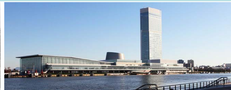
仙台トラストタワー