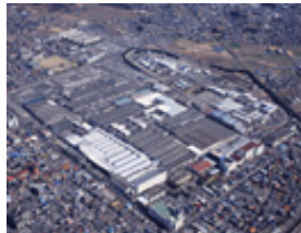
富士重工業群馬製作所本工場