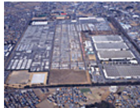
富士重工業群馬製作所大泉工場