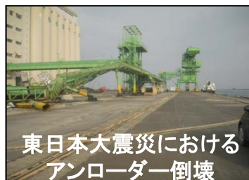
東日本大震災におけるアンローダー倒壊