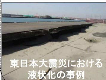
東日本大震災における液状化の事例

○港湾は高度成長期に埋め立てられた若齢地盤上に多くの機能が立地しており、地震による液状化被害が発生しやすい。