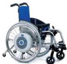
簡易型電動車椅子