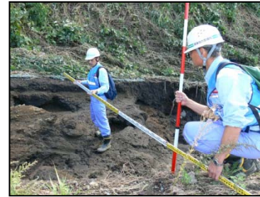
溪流における泥流痕跡調査