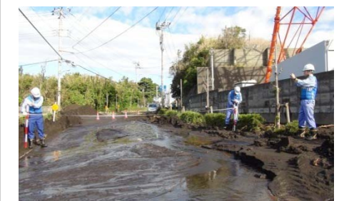
早期復旧に向けた被災箇所の把握