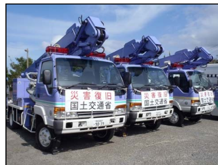
救助・救援活動支援のため照明車等派遣