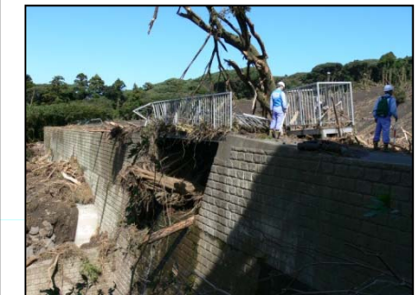
砂防ダム機能状況の確認