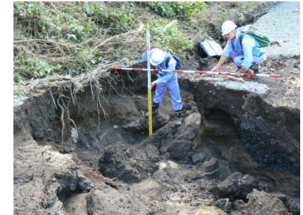
早期復旧に向けた被災箇所の把握