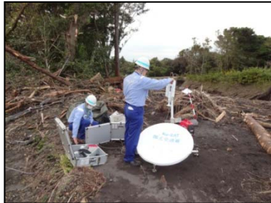
被災現場での監視カメラの設置