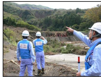
土石流流下状況調査