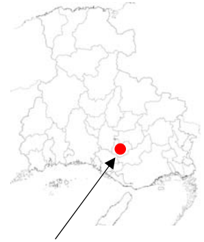
(主)三木宍粟線 栗田橋