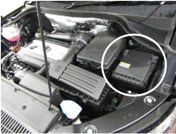
ヒューズボックス