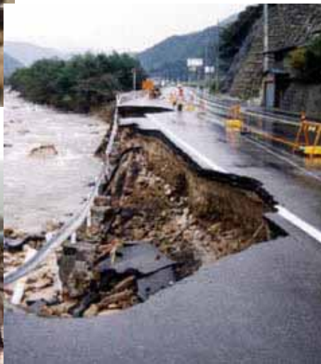
国道179号 護岸崩壊(三朝町助谷)