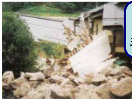
斜面崩壊(三朝町穴鴨)