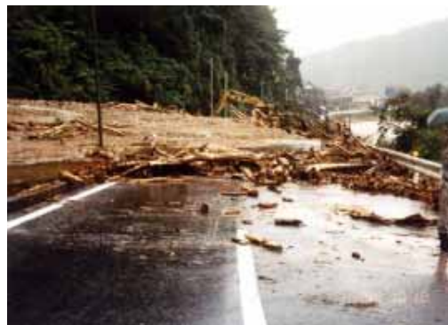
国道482号土砂流出(三朝町穴鴨)