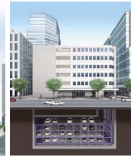
Space optimization by using underground area of parks, offices etc. .