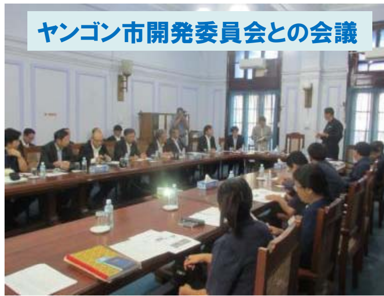
ヤンゴン市開発委員会との会議