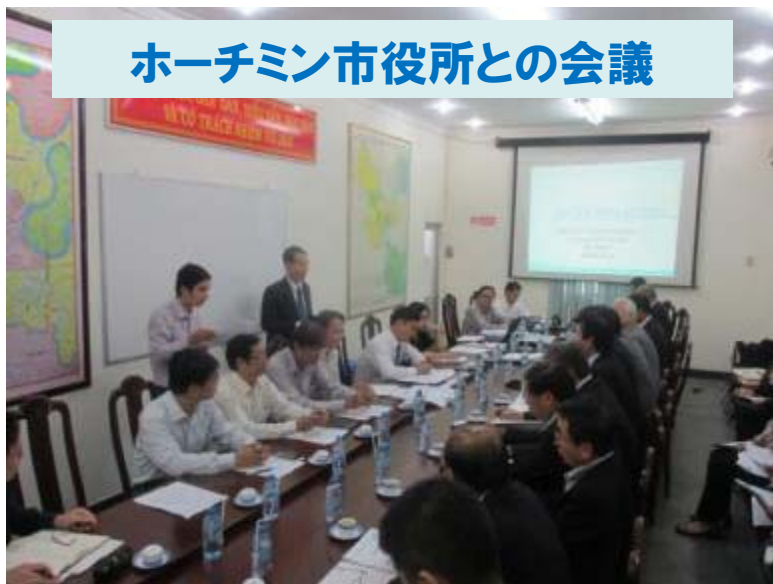
ホーチミン市役所との会議