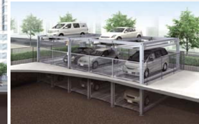
Maximize space for condominiums