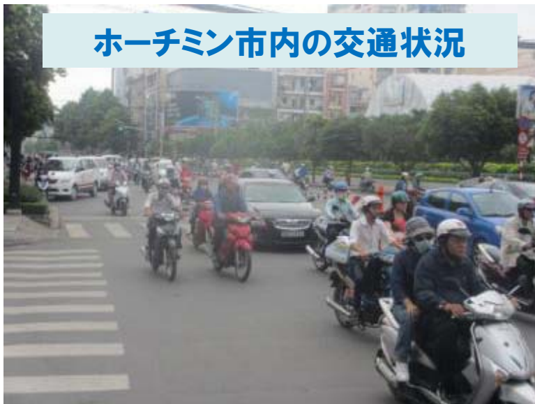
ホーチミン市内の交通状況