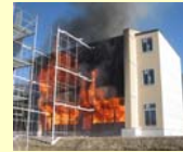
防火壁による延焼防止性能の検証