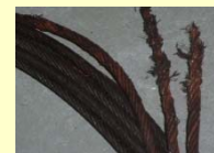
エレベーターのワイヤロープ破断事故