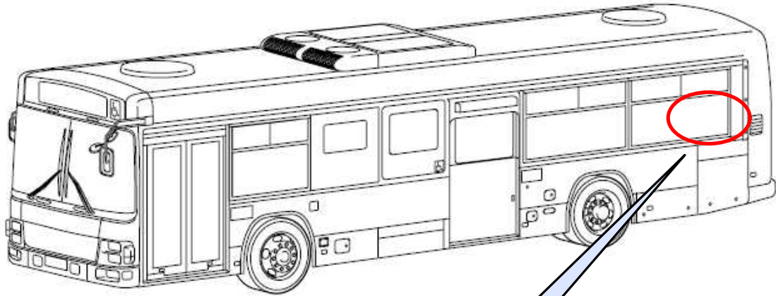
トランスミッション制御ユニット