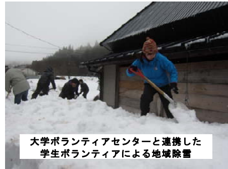
大学ボランティアセンターと連携した 学生ボランティアによる地域除雪