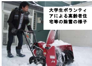
大学生ボランティアによる高齢者住宅等の除雪の様子