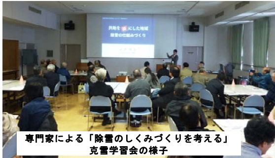
専門家による「除雪のしくみづくりを考える」 克雪学習会の様子