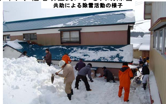
共助による除雪活動の様子