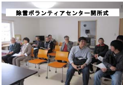
除雪ボランティアセンター開所式