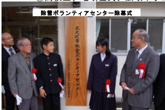
除雪ボランティアセンター除幕式